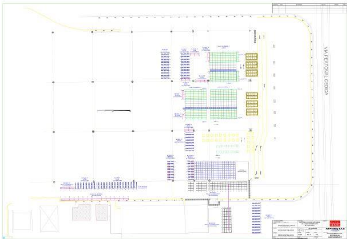
Figura 1. Plano de la locación

A continuación, se presenta el plano actualizado de la estantería con la que cuenta la locación.