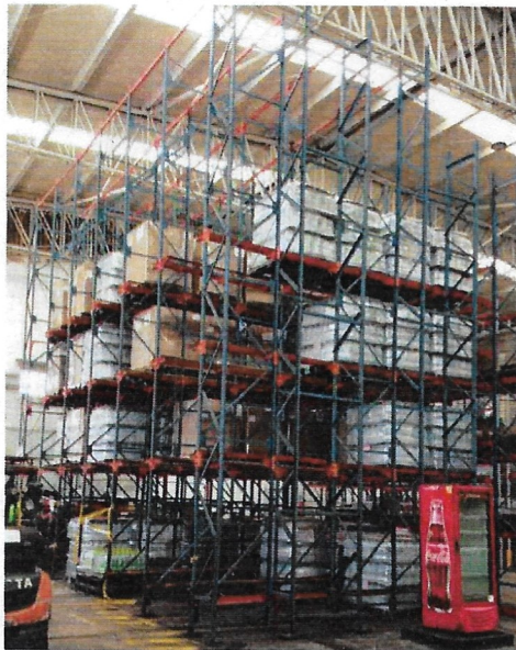
Estado inicial 6 calles

Mediante la presente acta se hace entrega del bloque 3 tipo drive in ubicado en el CEDI. Este bloque presentaba alto estado de corrosión razón por la cual se priorizó el desarme total, remoción de pintura, se pintó cada una de las piezas y se procedió al armado del mismo. Adicionalmente se fabricación de piezas para ampliar su capacidad en tres calles adicionales para 45 posiciones adicionales.