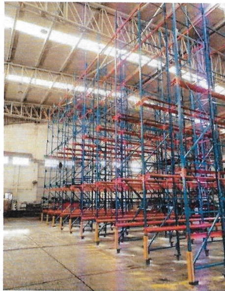
Estado final 9 calles